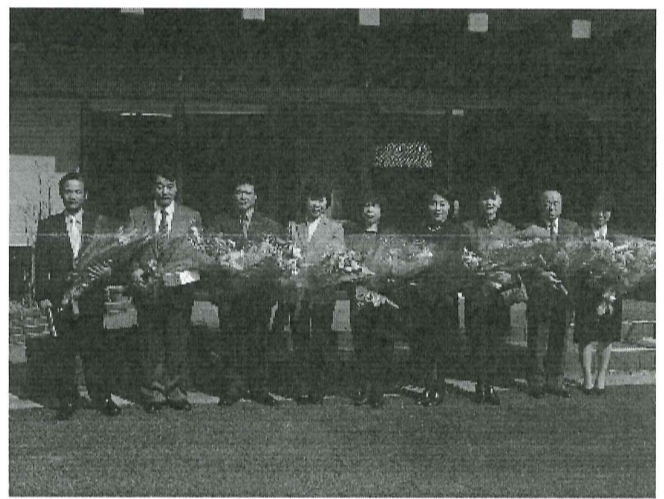
退職者された9名の皆さん