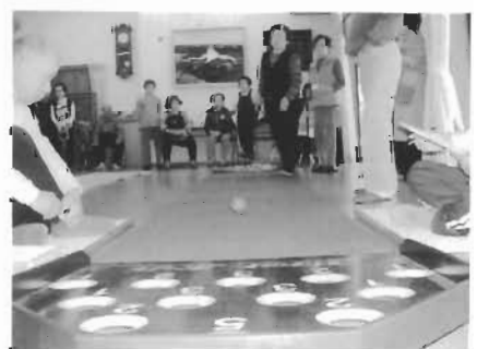
ピンボーリングを楽しむ東区の皆さん