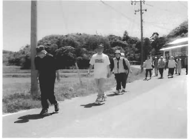
さつき晴れのこの日、宇受賀公民館前から地区内をウォーキングする様子

参加された皆さんはそれぞれ趣向をこらし、ウォーキング、クロリティー、ミニ運動会等町内のあちこちで、こころ良い汗を流しました。『なんといつても健康が一番！』このチャレンジデーでの取り組みをきっかけに、住民相互の連帯感を高めたり、日常の「健康増進」や「まちの活性化」を図るきっかけづくりに繋がっていくことを期待します。 町民の皆さん、来年もまたこのイベントにチャレンジし、「海士まるごと一体」となっていていい汗をかきましょう！