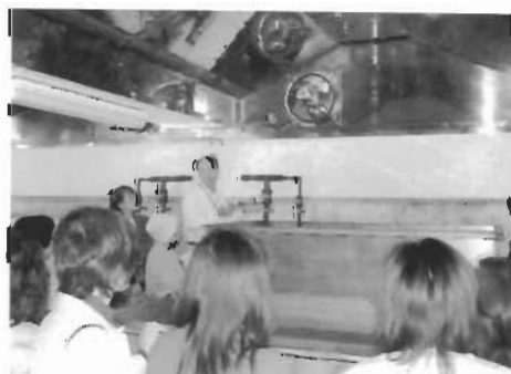
2基の塩釜の前で担当者の話を熱心に聞く