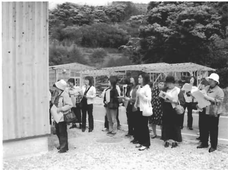
御塩司所の濃縮棟見学、敷地の後方には燃料の資材が置かれている

5月14日、母の日の集いとして「新産業の視察見学」と総会を行いました。当日は、30名の会員が集まり、この春稼働した御塩司所とCAS凍結センターを訪れ、まちの産業振興について、各担当者からの説明を熱心に聞くことができました。