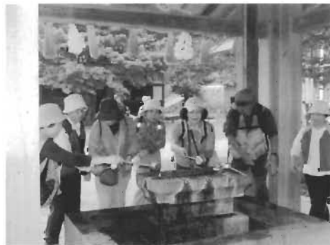
22 km、39 kmの折り返し地点の隠岐神社での様子