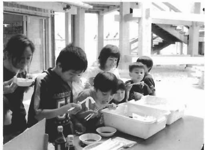
コリコリしてる～。おいしい!