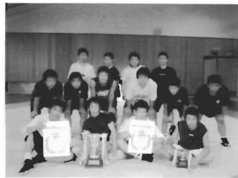
団体戦では11年連続優勝(17回目) また、団体と個人で1位になった選手は8月2日~5日に行われるインターハイへの出場権を獲得しました。

5月27日より6月5日まで、県内各地で総合体育大会各種競技が行われました。どの部も力の限り、悔いのない試合をすることができ、男女総合第7位(Bグループ)という輝かしい成績を収めることができました。たくさんの方々、温かいご声援有難うございました