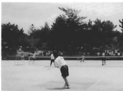
男子ソフトテニス部 個人戦で戦う一場面