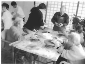
茶碗作りを楽しむ利用者

5月14日、母の日の集いとして「新産業の視察見学」と総会を行いました。当日は、30名の会員が集まり、この春稼働した御塩司所とCAS凍結センターを訪れ、まちの産業振興について、各担当者からの説明を熱心に聞くことができました。