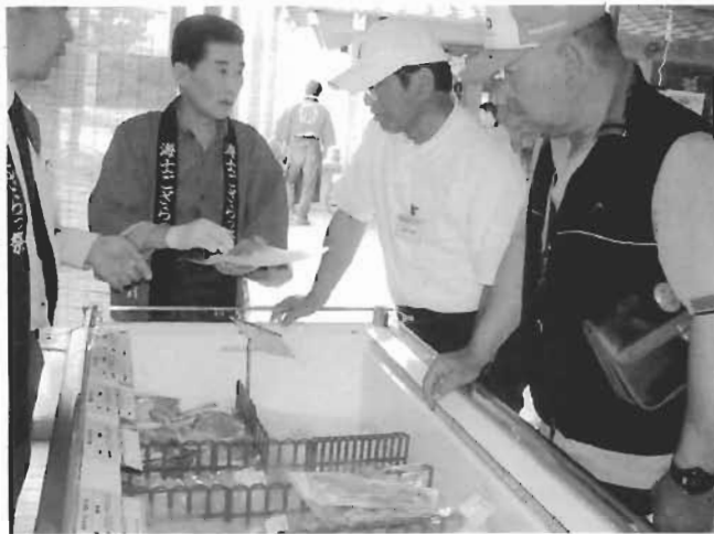
6月19日しゃん山で販売開始