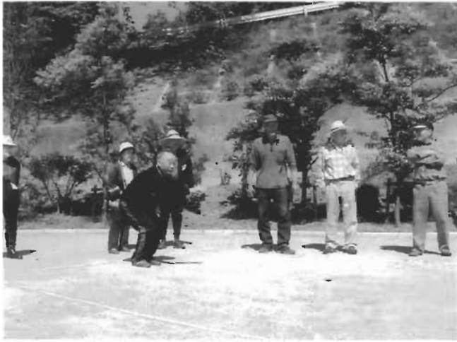
日頃の腕前を発揮！ペタンクを楽しむ崎地区のみなさん。