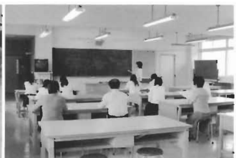
生徒、保護者とも熱心に学習する「発 育と保育」の授業公開の様子