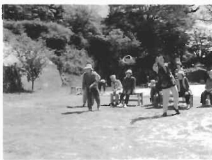
輪投げに挑戦。的めがけてそれえ〜。

5月25日、今年も町を挙げてチャレンジデーに参加しました。今回は、「団結」をテーマに各地区の公民館長さんを中心に実行委員会を結成し、地域、職場、団体、仲間同士を中心に取り組みました。 対戦相手は宮崎県南郷村（人口2,643人）で、海士町の参加率70・3%、南郷村73・7%で、結果勝利はのがしたものの、昨年より参加率が5・3%アップし、2年連続金メダルを獲得することができました。