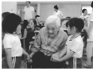
園児とのふれあいは心もなごみます

4月は、朝水揚げされたばかりの新鮮なネタを「う越佐」の店主がにぎり、利用者の方々に振る舞い、おいしいお寿司に舌鼓を打ちました。4月後半からは、利用者が陶芸に精を出し「抹茶茶碗」を作成し、5月に毎年ボランティアグループが開催する「野点」に自分で作った茶碗を持って参加し、『とても良いお手前のお茶』をいただきました。