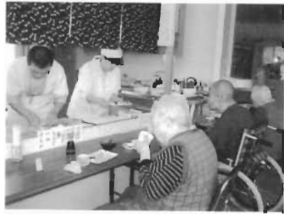
大人気！特設「う越佐寿司」開店

たいたたり、背中をさすったりすると、利用者の方々から自然と笑顔がこぼれ「疲れが取れるわい」「元気をもらったわ」と喜びの声が挙がりました。今後も諏訪苑では、地域の方々やボランティアと一緒に得る施設をめざしていきたいと思えます。