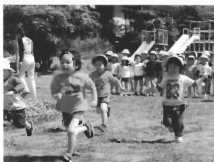
走る、走る、走る、元気いっぱいの保育園児たち