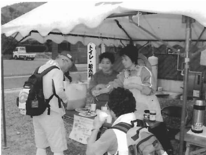
休憩所では、ヘルスメイトさんのフルーツポンチ、また、海士ノ塩で漬けた漬け物のサービスが大好評!

には欠かせないスポーツです。来年もまた町内はもちろん島外からのたくさんの方の参加者を期待したいところです。