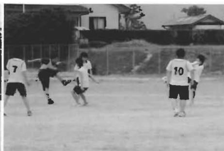
授業公開日にて… 一般の人も加わったサッカー