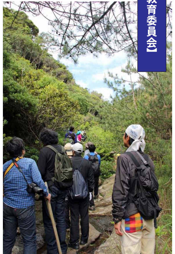
上陸後は草木をかき分け、目指すは月輪神社

当日は、多少船は揺れましたが、天候にも恵まれ、無事に松島に上陸することができました。